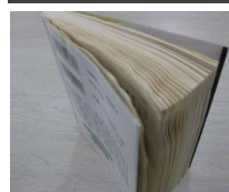
濡れてシワが残った本

借りている本のページが取れたり破れたりしてしまった時は、返却の際に本といっしょに取れたページをお持ちください。(セロハンテープは、時間がたつとはがれたり、跡が残ったりしてしまいますので、貼らないでください。)