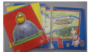
ページがばらばらになった本