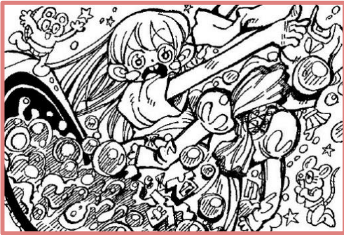
▲やりたいことがたくさんある幸せさん ありがとう！

まずはいつも過ごしている部屋を観察してみましょう。部屋のすみにホコリがたまっていたり、ゴミが落ちていたりしていませんか。あるいは、汚れた服がいつのまにかキレイになって、片づけられていませんか。普段生活しているのに気付かなかったのは、家族が先に気づいていたからです。家事は親がするものとやり過ごしてきた人が多いのではないのでしょうか。将来を考えても、今が始めるチャンスです。少しずつ身につけて、自活術を高めていきましょう！！