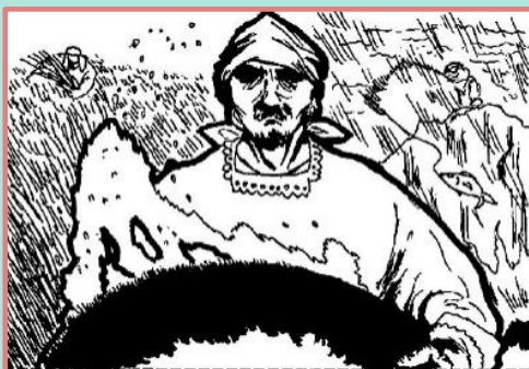
▲ サカナメロンさん ありがとう！