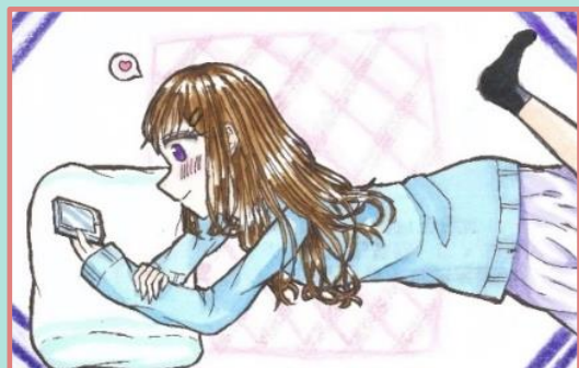
▲ haruさん ありがとう！

(応募方法) サンスクエア児童青少年図書館の応募箱に入れるか、各図書館のカウンターまで持参してね♪ (サイズ) 縦70mm×横110mm