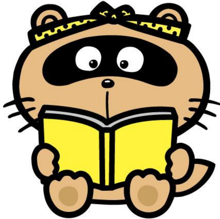
『東広島市観光マスコット「のん太」』

東 広 島 市 立 中 央 図 書 館 東広島市立サンスクエア児童青少年図書館 東 広 島 市 立 黒 瀬 図 書 館 東 広 島 市 立 福 富 図 書 館 東 広 島 市 立 豊 栄 図 書 館 東広島市立河内こども図書館 東 広 島 市 立 安 芸 津 図 書 館