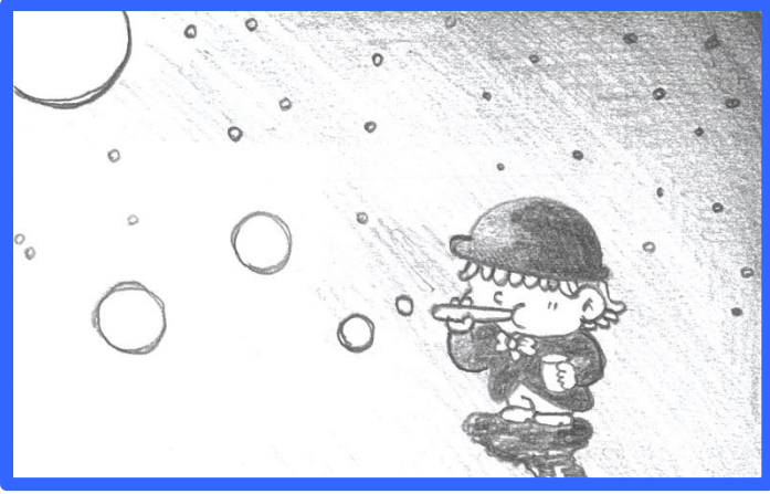
▲ dowteen.illustrationsさん ありがとうございます！