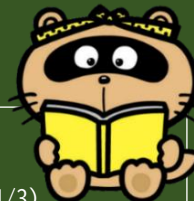
東広島市観光マスコット「のん太」